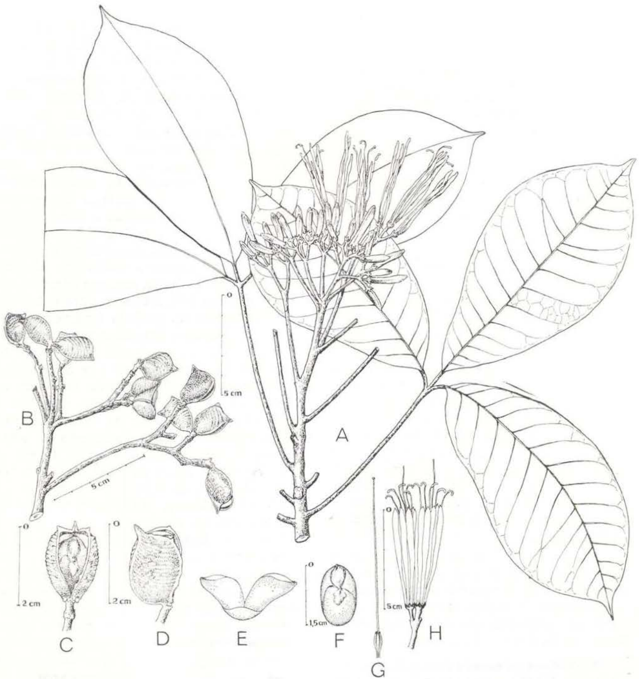
Fig. 1 — Spiranthera guianensis : A — Ramo florífero; B — Ramo frutífero; C — Fruto aberto em vista ventral; D — Fruto em vista lateral; E — Endocarpo; F — Semente; G — Pistilo; H — Detalhe da inflorescência mostrando duas flores. (Desenhos de Jorge Palheta e Alberto Silva)

comprimidas, cerca de 17 mm de comprimento e 11 mm de largura, dorso e ventralmente carinadas, carena dorsal terminando no ápice em ponta triangular-aguda cerca de 5 mm de comprimento por 2,5-3 mm de largura na base; endocarpo seco, livre, subdividido em dois, ás-