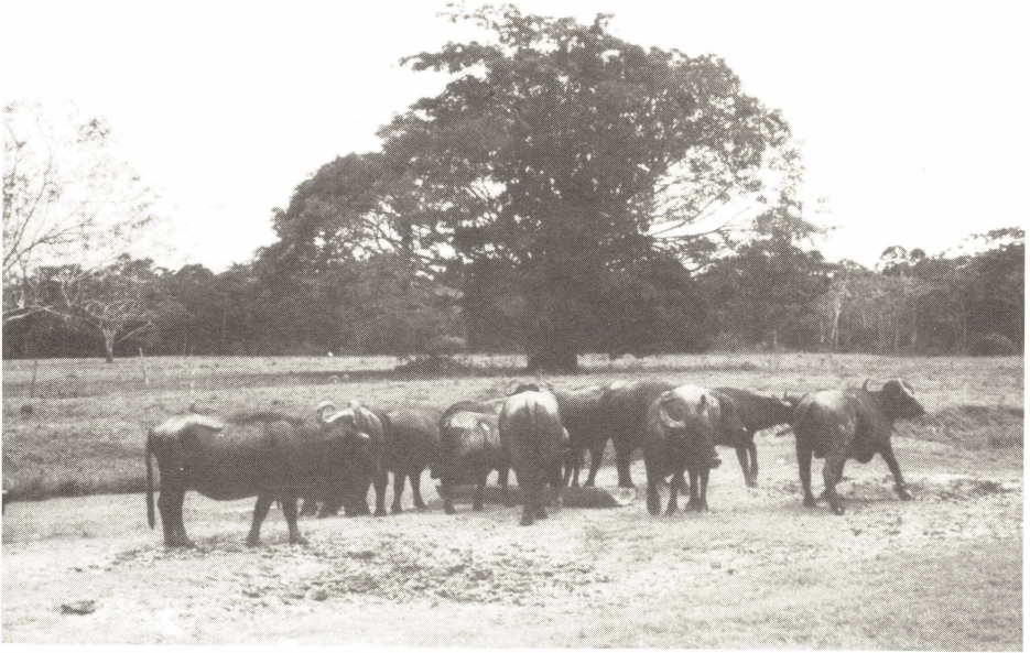
Abb. 1: Wasserbüffel am Mineralsaltzrog. Im Hintergrund ein typischer "Schattenbaum" ( Ficus spec. ).

Die Tiere sind nicht gekennzeichnet und die Hörner nicht entfernt. Trotz der extensiven und nachlässigen Haltungsform sind die scheuen Tiere in ihrem Verhalten durchwegs friedlich. Tagsüber weiden die Büffel frei auf der gesamten Farmfläche. Während der Nacht werden sie im "curral" eingepfercht, obwohl ihre Freßzeit sonst zu 40 - 50 % in die Nacht fällt (NASCIMENTO & MOREIRA 1974). Neugeborene Kälber bleiben tagsüber mit dem Muttertier im Pferch zusammen oder werden jeweils nur abends und morgens dem Muttertier bzw. einer Amme zugeführt.